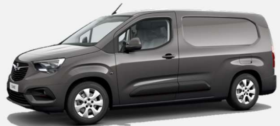
Moonstone Grey - G40 4 000kr