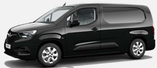
Diamond Black - G70 4 000kr