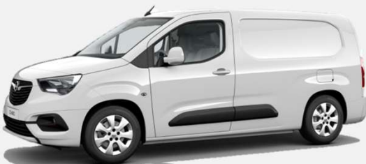
White Jade - G20 0kr