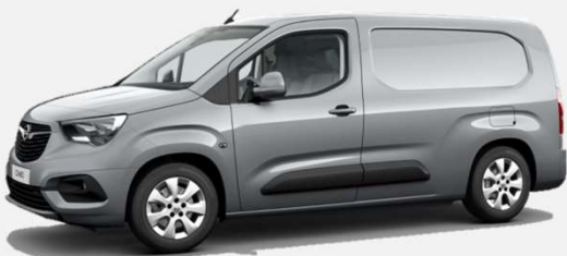
Quartz Grey - G4I 4 000kr