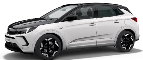
White Jade med svart motorhuv

Läs mer om Opels märkesförsäkring via TryggHansa här https://www.opel.se/service-och-tjanster/service-garanti-forsikring/opel-foersaekring