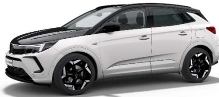
White Jade med svart motorhuv

Läs mer om Opels märkesförsäkring via TryggHansa här https://www.opel.se/service-och-tjanster/service-garanti-forsikring/opel-foersaekring