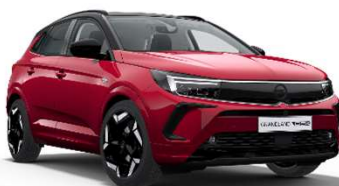
Dark Ruby Red