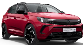
Dark Ruby Red