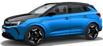
Vertigo Blue med svart motorhuv