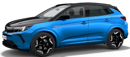
Vertigo Blue med svart motorhuv