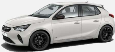
White Jade - G2o 0 kr