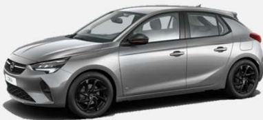
Quartz Grey - G4I (GSI) 4 900kr