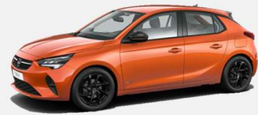
Orange Fizz- GPQ (D&T) 4 900kr