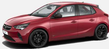
Hot Red - G1R 4 900kr