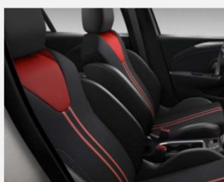
Banda, Marvel Black - TAVF