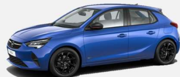
Voltaic Blue- GGI (D&T) 4 900kr