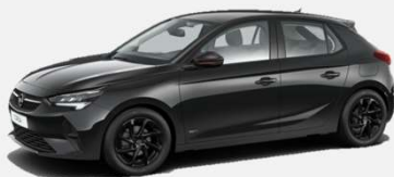
Diamond Black- G7o 4 900kr