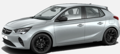
Artense Grey - GAU (D&T) 4 900kr