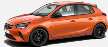
Orange Fizz- GPQ 4 900kr