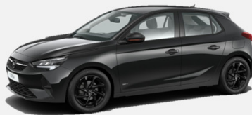
Diamond Black- G7o 4 900kr