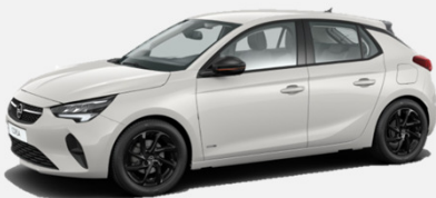
White Jade - G2o 0 kr