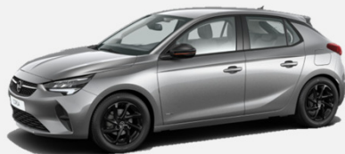
Quartz Grey - G4I 4 900kr