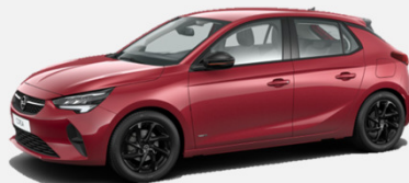
Hot Red - G1R 4 900kr