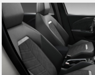
Alcantara klädsel, Jet Black- TAWT