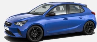
Voltaic Blue- GGI 4 900kr