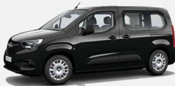
Diamond Black - G7o 5 000kr