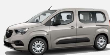
Cool Grey - GAC 5 000kr