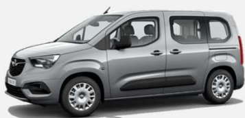
Quartz Grey - G4I 5 000kr