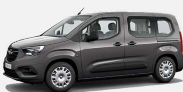
Moonstone Grey - G40 5 000kr