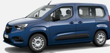
Night Blue - GOX 5 000kr