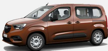
Copper - 10K 5 000kr