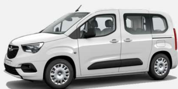
White Jade - G2o 0kr